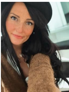
Design: Jenny Koschnick